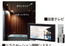
■リラクゼーション照明システム