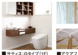
■サテライト:Gタイプ(1F)