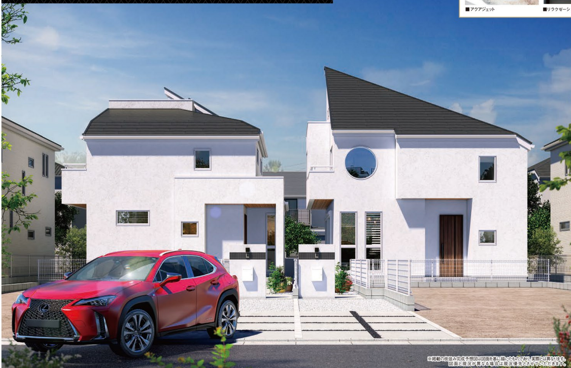
※掲載の街並み完成予想図は図面を基に描いたものであり、実際とは異なる場合があります。図面と現況が異なる場合は現況優先とさせていただきます。

所在地/東京都国分寺市富士本3丁目2番8号他(住居表示)交通/JR中央線「国立」駅徒歩20分○敷地面積/各111.73㎡(正味)○建物面積/89.01㎡・89.21㎡○土地権利/所有権○地目/宅地○用途地域/第1種低層住居専用地域○建ぺい率/50%○容積率/80%○その他法令上の制限/第1種高度地区、法22条区域○完成予定/2019年11月末○入居予定/2019年12月○建築確認番号/第18UDI3T 建03679号他○総邸数/全4邸○販売部数/今回販売2邸○販売価格/各4,580万円(税込)○設備/東京電力・公営水道・本下水・都市ガス(直ぐに利用可能な設備はありません)○接続状況/北東側5M公道○備考/敷地面積に路地状部分No.B:38.20㎡・No.C:37.90㎡含む○取引態様/媒介